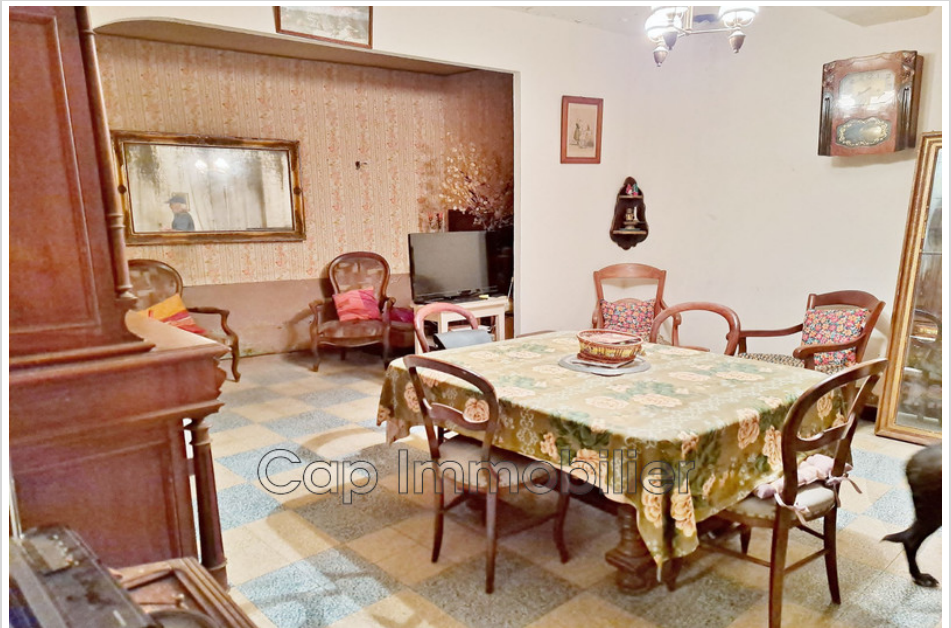
Maison de village Agde

Real estate purchase sale Agde - Large building to rehabilitate. Ref. : 525V200M - Mandat n°2881